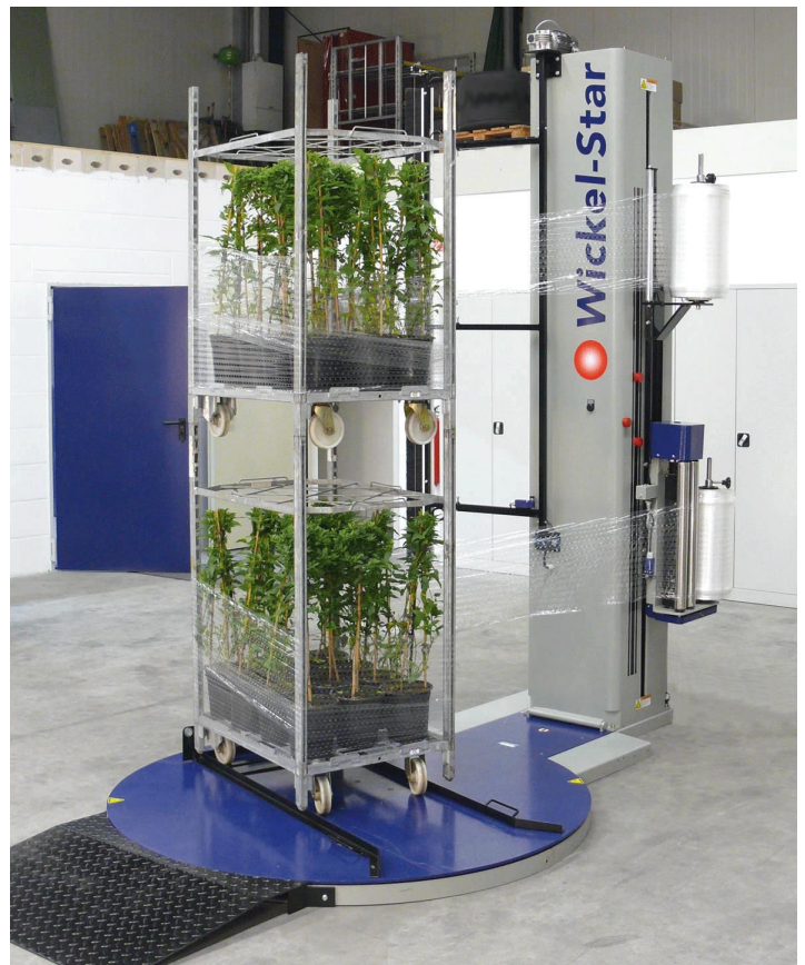
Abbildung: Basismaschine mit Zubehör - Trenneinrichtung - 2. Folienschlitten - Rampe kurz - Aufsetzrahmen CC/EC